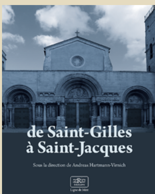
Collection Ligne de Mire

06 77 06 63 97 editions-marioncharlet@orange.fr