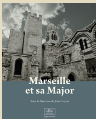
Collection Ligne de Mire